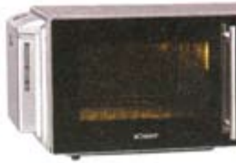
14) Bomann MWG 1212 D CB, 221 evra

Cena je povoljna. Loša je modla za roštilj. Moguće je potpuno čišćenje ćelićnog prostora za kuvanje kao i prednje strane koja je u ogledalu. Nema receptata i veoma malo preporuka za kuvanje.