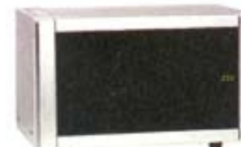
13) AFK MWDGCE-224M, 97 evra

Kuvanje na paru je ocenjeno sa zadovoljavajuće. Roštilj i vruć vazduh mogu da se koriste istovremeno. Nema rotirajućeg tanjira. Na donjem delu koćnica za vrata. Ima mnogo automatskih programa. Kod folije tastera nije obelećeno mesto pritiskanja. Vreme kuvanja na paru se produćava vremenom.