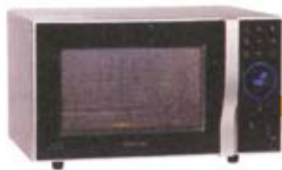
1) Samsung CE1185UB, 340 evra