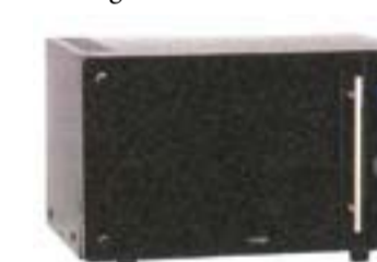
15) Germanic MWDGC-22BM, 116 evra

Ima mnogo automatskih programa. Kuvanje na paru je ocenjeno sa dovoljno. Nema vrućeg vazduha. Tekst tastera je veoma sitan. Moguće je potpuno čišćenje ćelićnog prostora za kuvanje kao i prednje strane koja je u ogledalu.