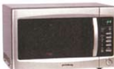
2) Quelle/Privileg, 180 evra

Upotreba je veoma jednostavna, podešavanje programa praćeno svetlosnim oznakama. Roštilj na poleđeini može da se sklopi. Pećenje na dva nivoa. Rotirajući tanjir može da se isključi. Držac za pećenje postavljen masom koja sprećava lepljenje. Čišćenje je jednostavno, pomoću programa sa parom.