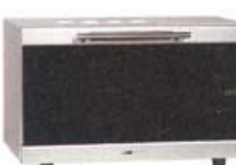
10) Clatronic MWG 759 H, 112 evra

Istovremeno može da se koristi vruć vazduh i roštilj sa mikrotalasima. Dobar prikaz automatskih programa za kuvanje. Najlošije ocenjeno uputstvo.