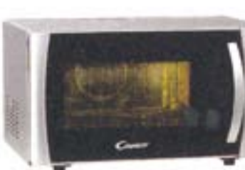
9) Cady CMC 2395 DS, 188 evra

Istovremeno može da se koristi vruć vazduh i roštilj sa mikrotalasima. Dobar prikaz automatskih programa za kuvanje. Tekst na tasterima je nejasan ponegde i veoma sitan. Nema preporuka za kuvanje niti receptata.