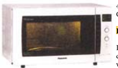
4) Panasonic NN-CD757W, 370 evra

Dobra podešavanja automatskih programa i praćenje preko displeja. Polje sa tasterima ispisano je nemaćkim jezikom. Kod folije tastera nije obelećeno mesto pritiskanja. Uska rućka na vratima. Moguće je potpuno čišćenje ćelićnog prostora za kuvanje.