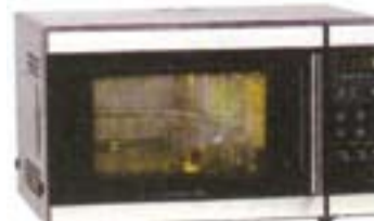
11) Daewoo KOC-6290, 124 evra

Na donjem delu koćnica za vrata. Dugaćko vreme kuvanja za picu i piletinu. Moguće je potpuno čišćenje ćelićnog prostora za kuvanje kao i prednje strane koja je u ogledalu.