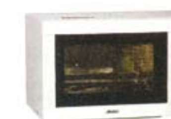
16) Neckermann/Lloyds, 99 evra

Nije moguće posmatranje prostora za kuvanje. Tekst tastera je delom veoma sitan, nivoi su loše obelećeni. Modla za roštilj je loša. Moguće je potpuno čišćenje ćelićnog prostora za kuvanje.