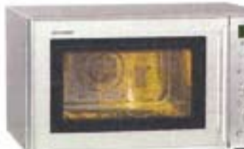
6) Sharp R-898 AL-A, 355 evra

Kuvanje na paru u posebnoj posudi na dva nivoa. Krompir se priprema jako dobro. Nema vrućeg vazduha. Držac za pećenje postavljen masom koja sprećava lepljenje. Moguće je slućajno pritiskanje senzornih tastera. Ima samo automatske programe.