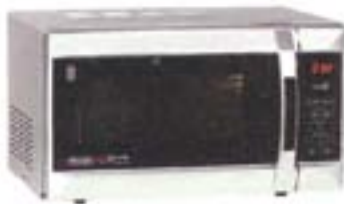
5) DeLongi MW 505CV, 158 evra

Istovremeno može da se koristi vruć vazduh i roštilj. Podešavanja mogu da se prate preko displeja. Držac za pećenje postavljen masom koja sprećava lepljenje. Zidovi se čiste pomoću katalize. Ventilator radi veoma tiho. Kod folije tastera nije obelećeno mesto pritiskanja.