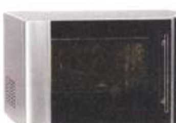
8) Severin MW 7803, 178 evra

Dobra preglednost prostora za kuvanje kao i gornje koso polje sa tasterima. Na donjem delu koćnica za vrata. Uska rućka na vratima. Ima mnogo automatskih programa. Držac za pećenje postavljen masom koja sprećava lepljenje. Zidovi se čiste pomoću katalize.