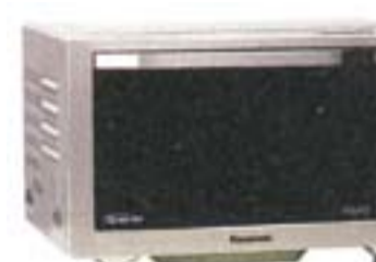
12) Panasonic NN-CS596S, 645 evra

Roštilj i vruć vazduh se ne mogu pojedinaćno ukljućivati. Ima malo automatskih programa. Vreme kuvanja je veoma dugo. Moguće je potpuno čišćenje ćelićnog prostora za kuvanje. Nema preporuka za kuvanje niti receptata.