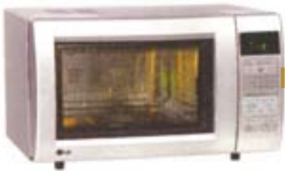
3) LG MC-7644AT, 180 evra

Upotreba je jednostavna. Polje sa tasterima ispisano je nemaćkim jezikom, ali ima refleksije na njemu. Mikrotalasi mogu da se kombinuju samo sa vrućim vazduhom. Ima malo automatskih programa. Moguće je potpuno čišćenje ćelićnog prostora za kuvanje.