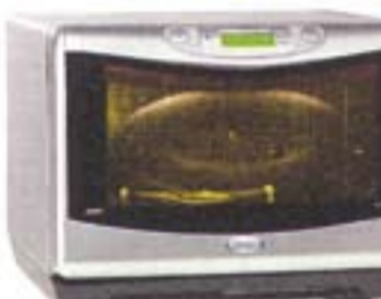
7) Whirlpool JT 358 AL, 290 evra

Držac za roštilj u gornjem i donjem delu. Biranje funkcije preko prekidaća koji se okreće i dobro je obelećen. Jasan opis tastera i korisnićkih elemenata. Podešavanja i prikaza na displeju.