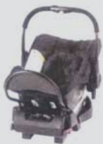
Brio Primo mit Isofix-basis, 198 Euro

Tokom 2009. godine StiftungWarentest je testirao kvalitet 22 auto sedišta za decu, podeljenih u pet grupa prema težini dece. Grupa 0+; od rođenja do 13 kg; Grupa 0+/I; od rođenja do 18 kg; Grupa I od; 9 do 18 kg; Grupa I/II/III; od 9 do 36 kg; Grupa II/III; od 15 do 36 kg. Prosečna cena sedišta u Nemačkoj kreće se od 49 do 480 eura.