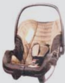
Nania Be-One SP ab 49 Euro